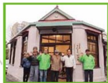
旧鍋屋交番 きたまち案内所

近鉄奈良駅の北側。「奈良きたまち」の愛称で親しまれており、昭和の暮らしが残るレトロな町並みが広がる。この界隈に近年、こだわりのある店が続々オープン。自分らしい暮らしを求める人が集う生活の場「奈良きたまち」を散策しよう。